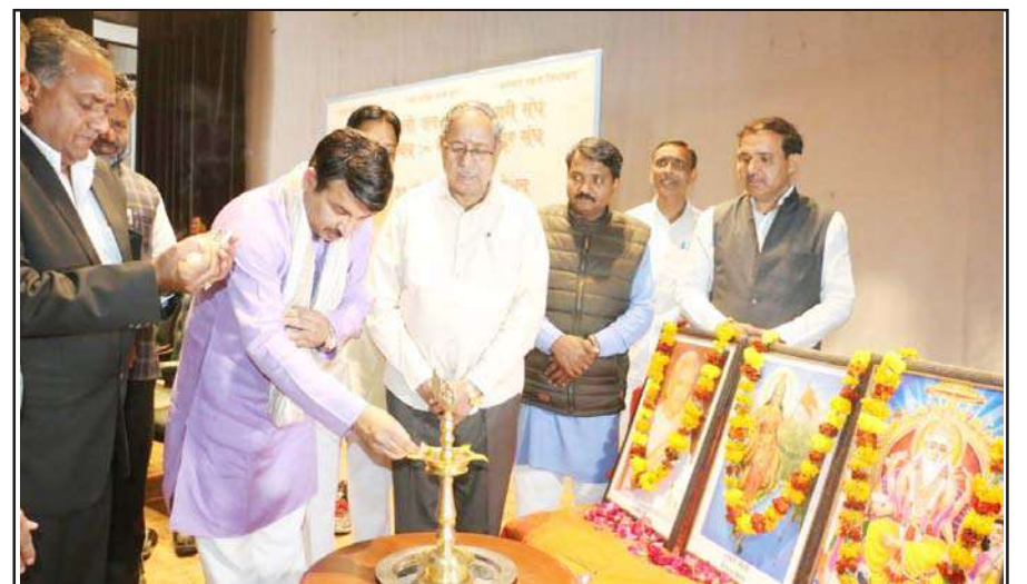
दिल्ली जल मल कर्मचारी संघ के 22वें वार्षिक अधिवेशन के अवसर पर दीप प्रज्वलित करते सांसद मनोज तिवारी।

मनोज तिवारी ने कहा कि आज जब दिल्ली जल बोर्ड बड़े लाभ में चल रहा है ऐसे समय दिल्ली के सरकारी या प्राइवेट सीवर सफाई कर्मियों की इस तरह दुखद मृत्यु के समाचार हमें विचलित करते हैं। उन्होंने कहा कि गत दो वर्षों में स्वयं मैंने राष्ट्रीय सफाई कर्मचारी आयोग के माध्यम से दिल्ली में ऐसी घटनाओं में मृत कर्मचारियों के परिवारों को राहत दिलाने का प्रयास किया पर अनेक वाद्यों के बाद भी केजरीवाल सरकार ने सफाई कर्मियों को आवश्यक उपकरण