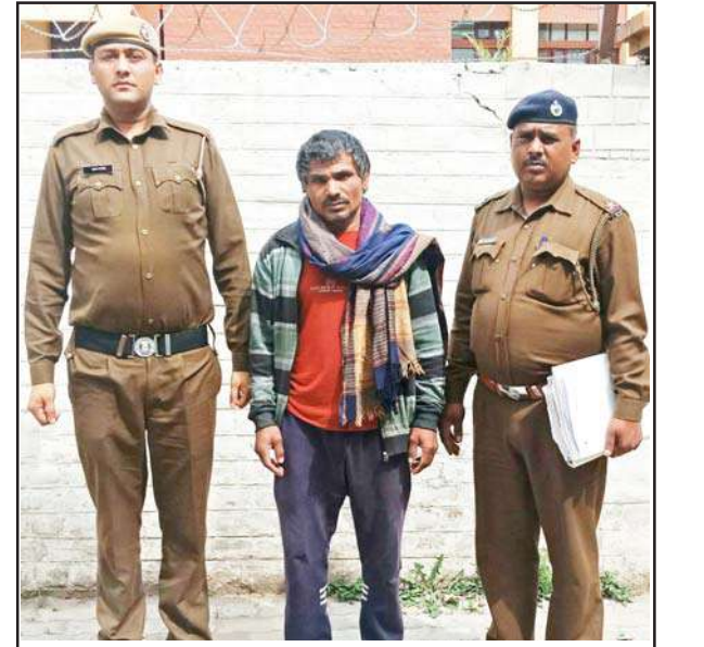
पकड़ा गया वांछित उदघोषित आरोपी थाना बेरी की टीम के साथ।