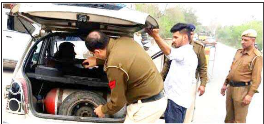
नाका पर मुस्तैदी से तैनात झज्जर पुलिस की अलग-अलग टीमों।