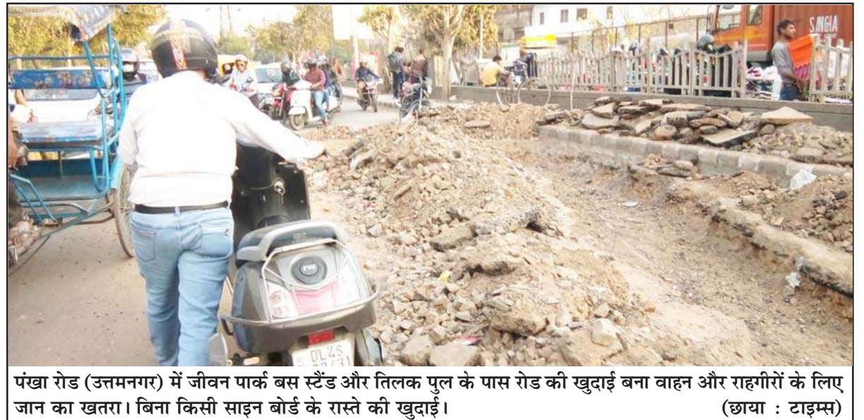
पंखा रोड (उत्तमनगर) में जीवन पार्क स्टैंड और तिलक पुल के पास रोड की खुदाई बना वाहन और राहगीरों के लिए जान का खतरा। बिना किसी साइन बोर्ड के रास्ते की खुदाई।