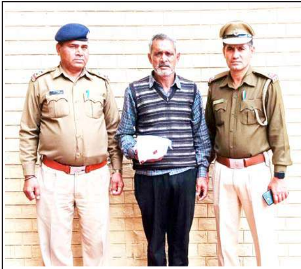
मादक पदार्थ चरस के साथ पकड़ा गया आरोपी सीआईए झज्जर की टीम के साथ।