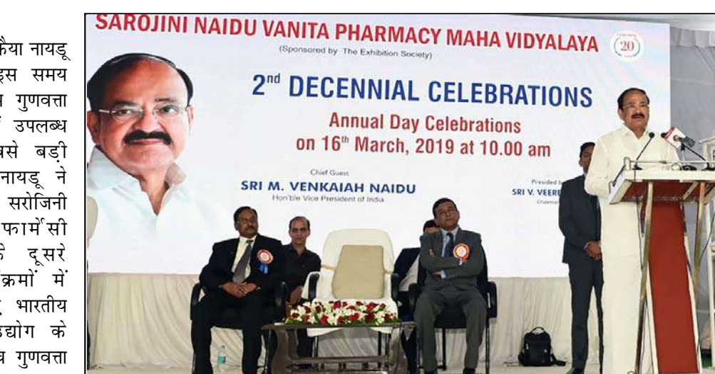
हैदराबाद। सरोजिनी नायडू वनिता फार्मैसी महा विद्यालय के 2 वें उत्सव समारोह में सभा को संबोधित करते उपराष्ट्रपति एम वेंकैया नायडू।

उप राष्ट्रपति एम वेंकैया नायडू ने कहा है कि इस समय विश्व स्तरीय उत्तम गुणवत्ता वाली सस्ती दवायें उपलब्ध कराया जाना सबसे बड़ी आवश्यकता है। नायडू ने शनिवार को यहां सरोजिनी नायडू वनिता फार्मैसी महाविद्यालय के दूसरे दसवार्षिक कार्यक्रमों में शिरकत करते हुए भारतीय फार्मास्यूटिकल उद्योग के प्रतिनिधियों से उच्च गुणवत्ता युक्त सस्ती दवाएं उपलब्ध कराने को आग्रह किया। उन्होंने कहा कि दवाओं के निर्माण में विश्व स्तरीय मानकों का कड़ाई से पालन होना चाहिए और दवाओं की उपलब्धता के साथ कोई समझौता किये बगैर नई दवाओं की खोज पर भी ध्यान दिया जाये। नायडू ने शोध और