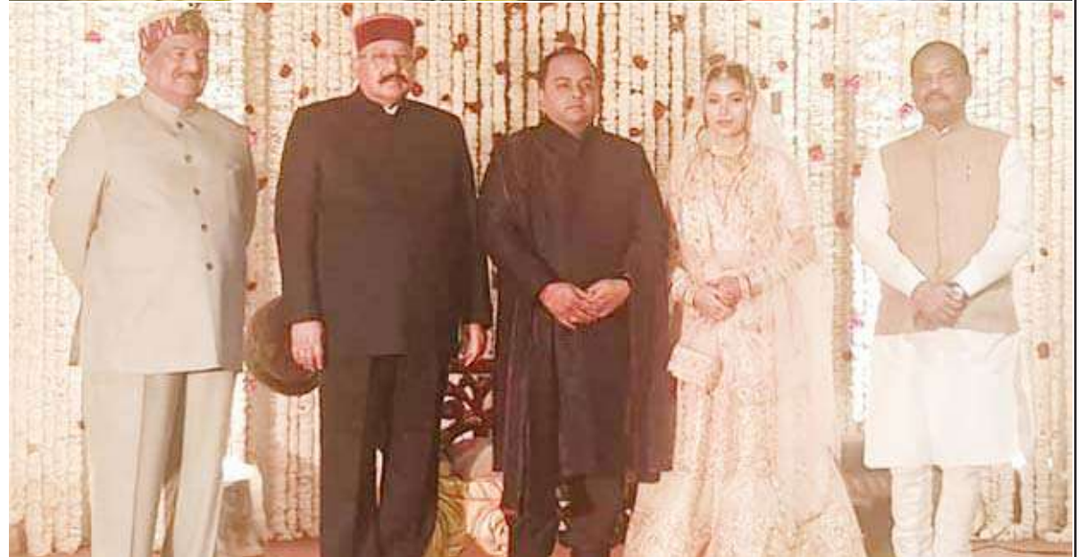
झारखंड के मुख्यमंत्री रघुवर दास के सुपुत्र के मांगलिक विवाह समारोह में सम्मिलित माननीय प्रधानमंत्री नरेंद्र मोदी, माननीय गृहमंत्री राजनाथ सिंह, उत्तराखंड के कैबिनेट मंत्री माननीय सतपाल जी महाराज, माननीय कृषि मंत्री राधा मोहन सिंह, भाजपा के वरिष्ठ नेता लालकृष्ण आडवाणी, अनेक केंद्रीय और राज्य मंत्रियों सहित बड़ी-बड़ी हस्तियों ने नवविवाहित जोड़े को आशीर्वाद दिया।।